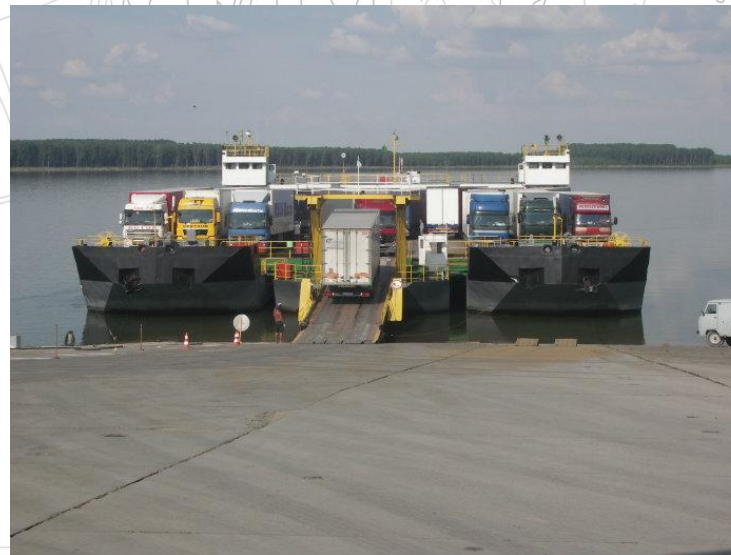
Bac la Oriahovo - Bechet

Porturile CNE "Kozlodui" și portul din orașul Oriahovo sunt adaptate pentru manipularea de mărfuri și materii prime, însă doar cel de la centrala nucleare este folosit exclusiv intern. Potentialul, de care dispune punctul de control de la Oriahovo și cele două bacuri - cel românesc și cel bulgăresc, permit pentru 24 de ore să fie prelucrate 200 camioane de mare tonaj la intrare și 200 la ieșirea din țară.