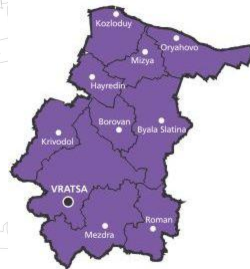
Primăriile regiunii Vratsa

Din punct de vedere climatic zona se încadrează în subregiunea continentală moderată.